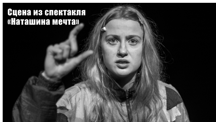
Сцена из спектакля «Наташина мечта»