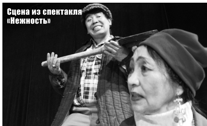
Сцена из спектакля «Нежность»

Для спектакля из Франции под названием «Принимая во внимание», пожалуй, перевод не потребуется: театральная компания «Ля Шартрез» предлагает яркое мультимедийное действие, составленное из музыки, песен и театральных световых спецэффектов.