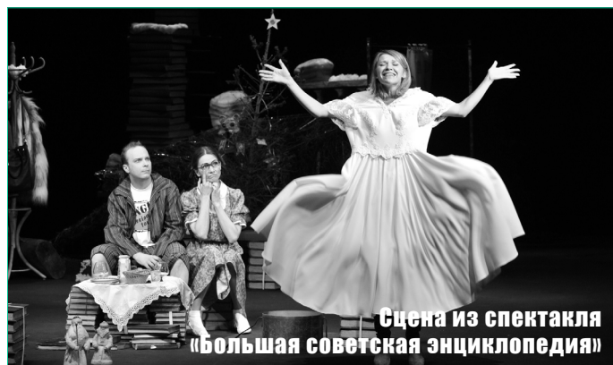
Сцена из спектакля «Большая советская энциклопедия»