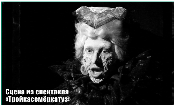
Сцена из спектакля «Тройкасемеркатуз»

Это жутковатая и в чём-то сюрреалистическая комедия, в основе которой – разноязычие. Главного героя Германна окружающие не понимают в буквальном смысле: он немец и весь спектакль он говорит по-немецки. Спектакль из Кишинёва – яркая театральная фантазмагория, перекликающаяся с сегодняшним временем.