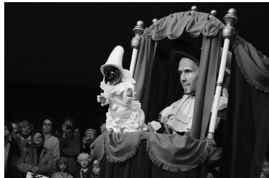
Актер Екатеринбургского театра кукол открывает V фестиваль "ПЕТРУШКА ВЕЛИКИЙ"

...Это самая обыкновенная история одного замечательного театрального Праздника. Обыкновенная счастливая история, которая творится Вами и на Ваших глазах!