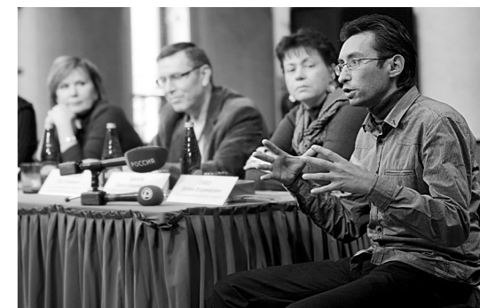
Международный фестиваль театров кукол «ПЕТРУШКА ВЕЛИКИЙ» ждет тебя!

За время проведения фестиваля будет показано 18 спектаклей и, в отличии от прошлого года, когда в программе практически отсутствовали представления для детей, на этот раз «Петрушка» покажет нам всего лишь три спектакля для взрослых: «Маленькие трагедии» (г.Екатеринбург) и «Пиковая дама» театра из Гродно (Белоруссия) по А. С. Пушкину «Гроза» по Островскому Петрозаводского кукольного театра. На все остальные спектакли можно идти всей семьей. Для самых маленьких интересны будут сказки: «Колобок» Санкт-Петербургского кукольного