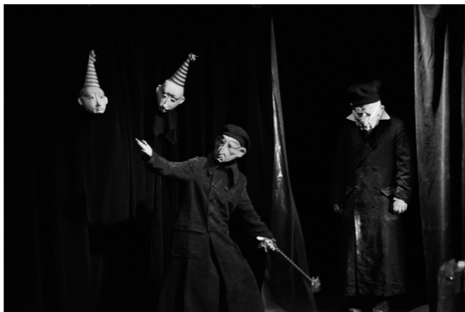
Спектакль «Обаяние идиотизма» синтетического театра "Цахес" стал успехом прошлого фестиваля.

Участниками второго Фестиваля стали 14 театров, то в 2006 уже 18.