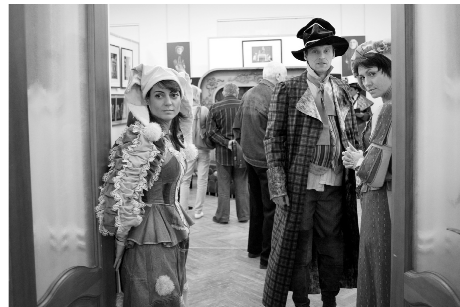
Выставочные экспонаты сами выходили встречать посетителей.