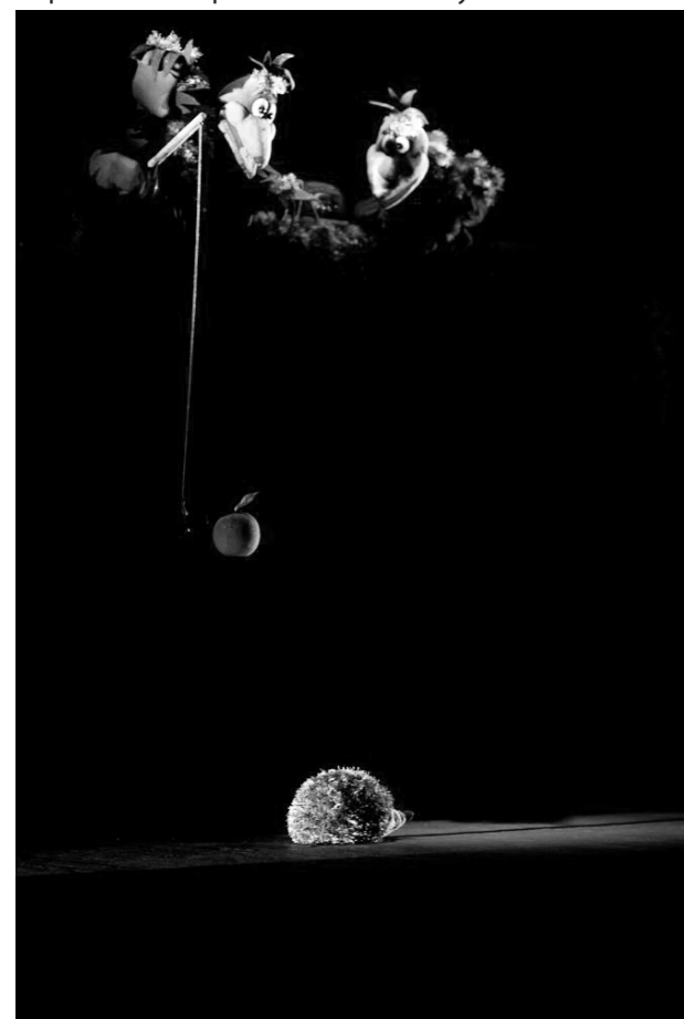
Спектакль был номинирован на Национальную премию «Золотая маска - 2011»

С помощью друзей разобравшись с тем, что в его песенке обозначает «тру-лю-лю», козленок все же сохранил еще одну загадку: смысл загадочного «флюм-пам-пам»? И в поисках ответа маленький герой отправился в свое новое путешествие. А уж каким оно будет, каждый зритель может придумать сам.