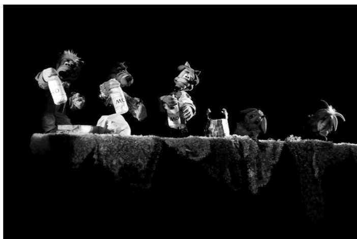
Музыка спектаклю была написана специально в жанре классического джаза: блюз, свинг, рок-н-ролл.

художник-постановщик в одном лице придумал удивительно красивые, яркие куклы, к которым очень хочется прикоснуться. Не случайно в 2011 году его работа была номинирована на «Золотую Маску». Сказка, сделанная в классической технике черного кабинета, кажется простой и незамысловатой. И лишь на поклоне, когда на сцене появляются 14 артистов, скрывавшихся за лесными героями, становится понятно, какое потрясающее мастерство потребовалось от кукловодов для создания спектакля.