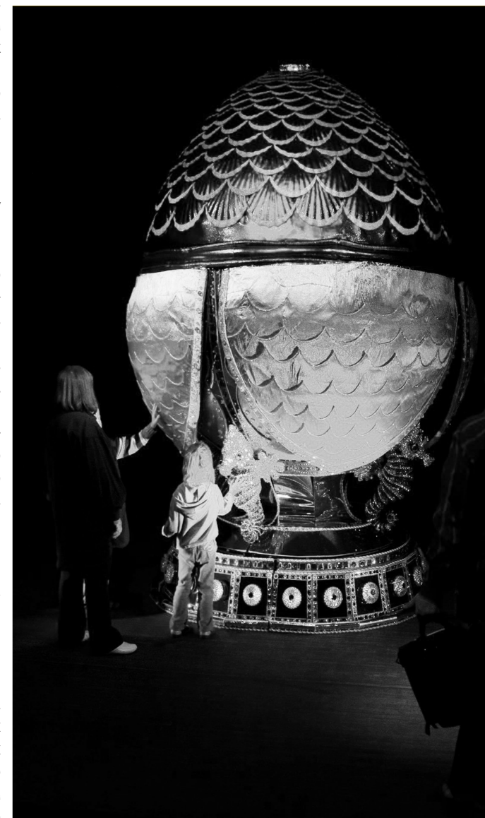
Основой для спектакля послужила опера Римского-Корсакова «Садко», а художественное решение было вдохновлено ювелирными изделиями Карла Фаберже

очень необычный и лучше всего его можно охарактеризовать словом «инновационный». Однако проблема этой постановки заключена в отсутствии слов. Музыка, записанный «закадровый» голос рассказчика и визуальный ряд ведут к тому, что к середине спектакля внимание рассеивается, становится сложно следить за сюжетом. Очень не хватает живых голосов актеров, чтобы оживить всю эту красоту на сцене и вдохнуть в нее жизнь. Без этого прекрасное яйцо похоже на изобретение сумасшедшего ученого, и совершенно неясно, куда его приспособить.